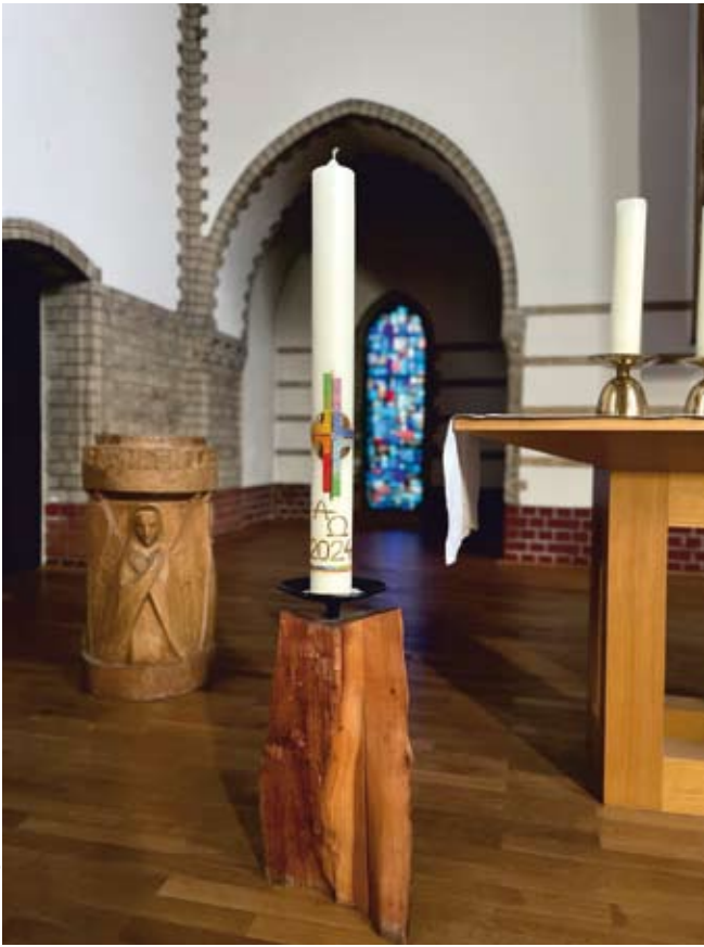
Tilman Reger / 2024

In der Osternacht wurde die neue Osterkerze für das Jahr 2024 entzündet. Schauen Sie sich die Kerze bei Ihrem nächsten Besuch der Trinitatiskirche einmal aus der Nähe an: Im Herzen des vielfarbigem Wachsbildes sitzt ein besonderes Schmuckstück.