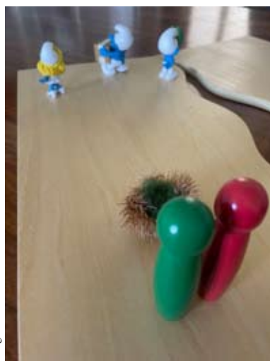
Ansgard v. Maltzahn-Rühle / 2023

In der 2. Etage des Gemeindehauses üben sich die Kleinsten mit Bewegung und Liedern in den musikalischen Grundfähigkeiten. Für Kinder im ersten Lebensjahr vermittelt „PEKiP“ Spiel und Bewegungsanregungen ab der 6. Lebenswoche und Eltern können sich untereinander austauschen.