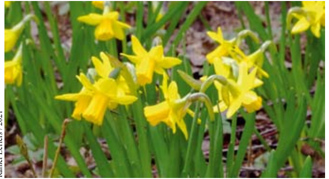
Rainer Leffers / 2021